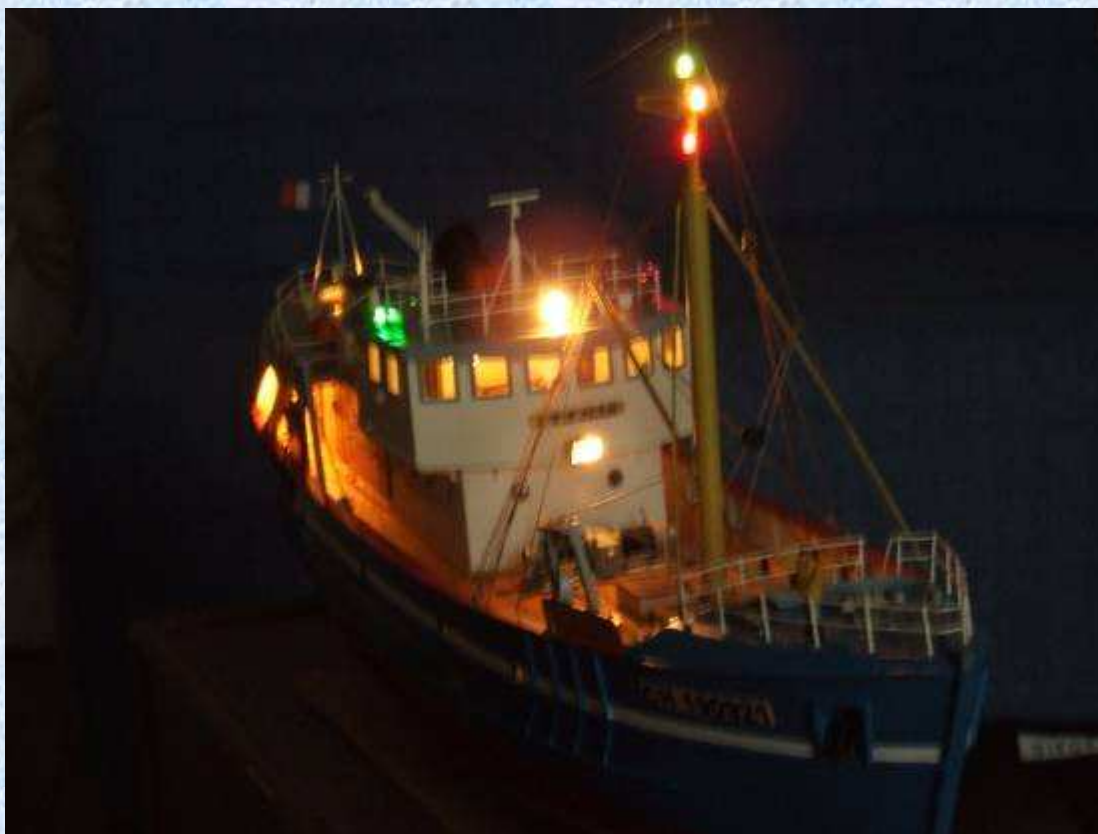
Le voila avec tous ses feux allumés.