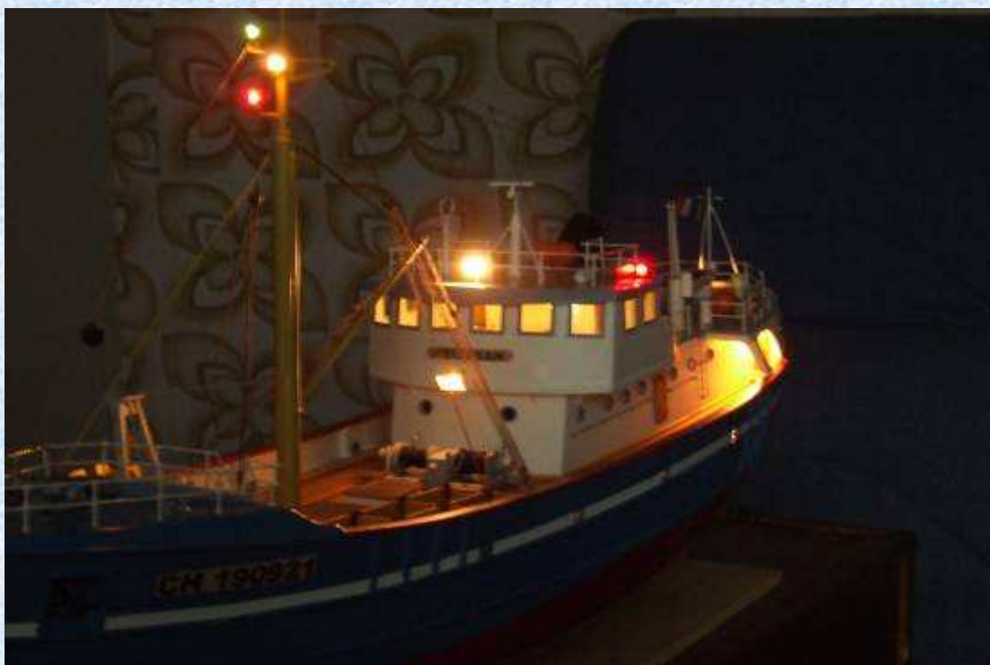
Une vue coté bâbord.