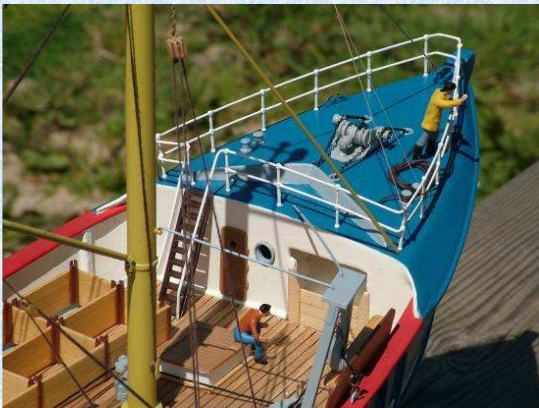
Gros plan sur le roof avant.