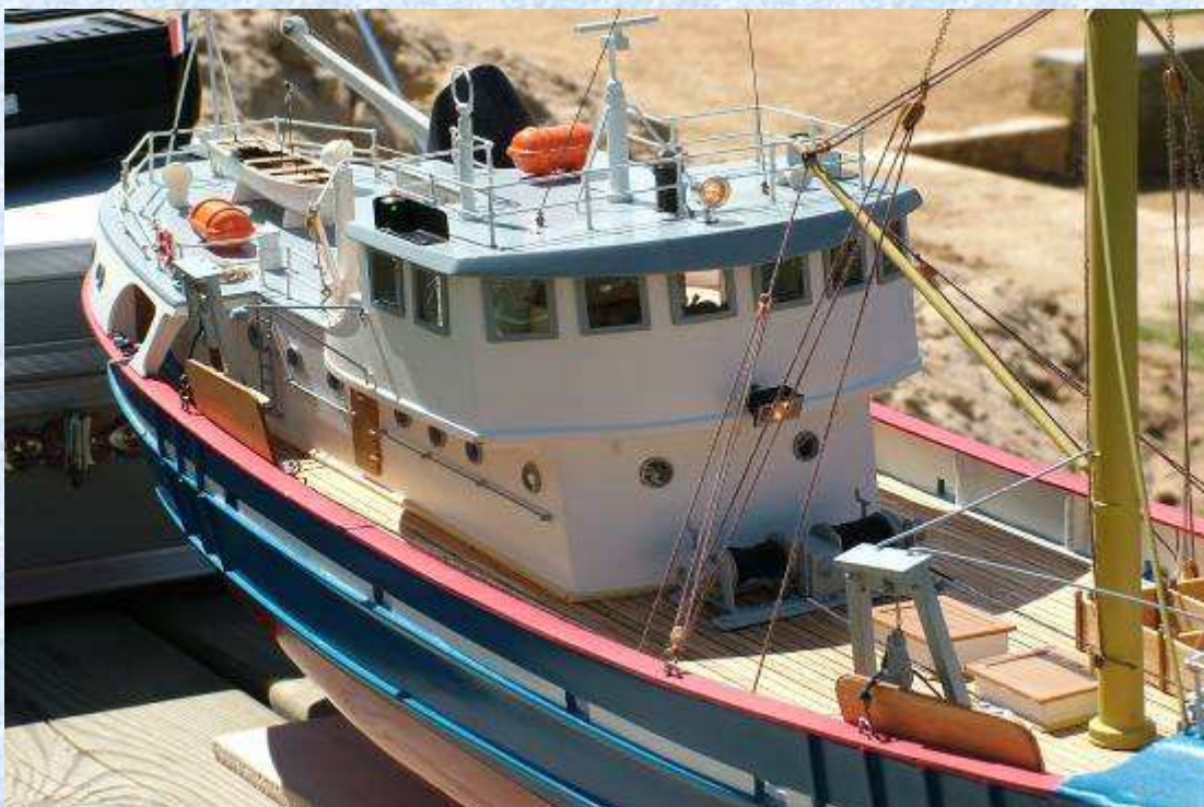
Le voici après son carénage en 2005.