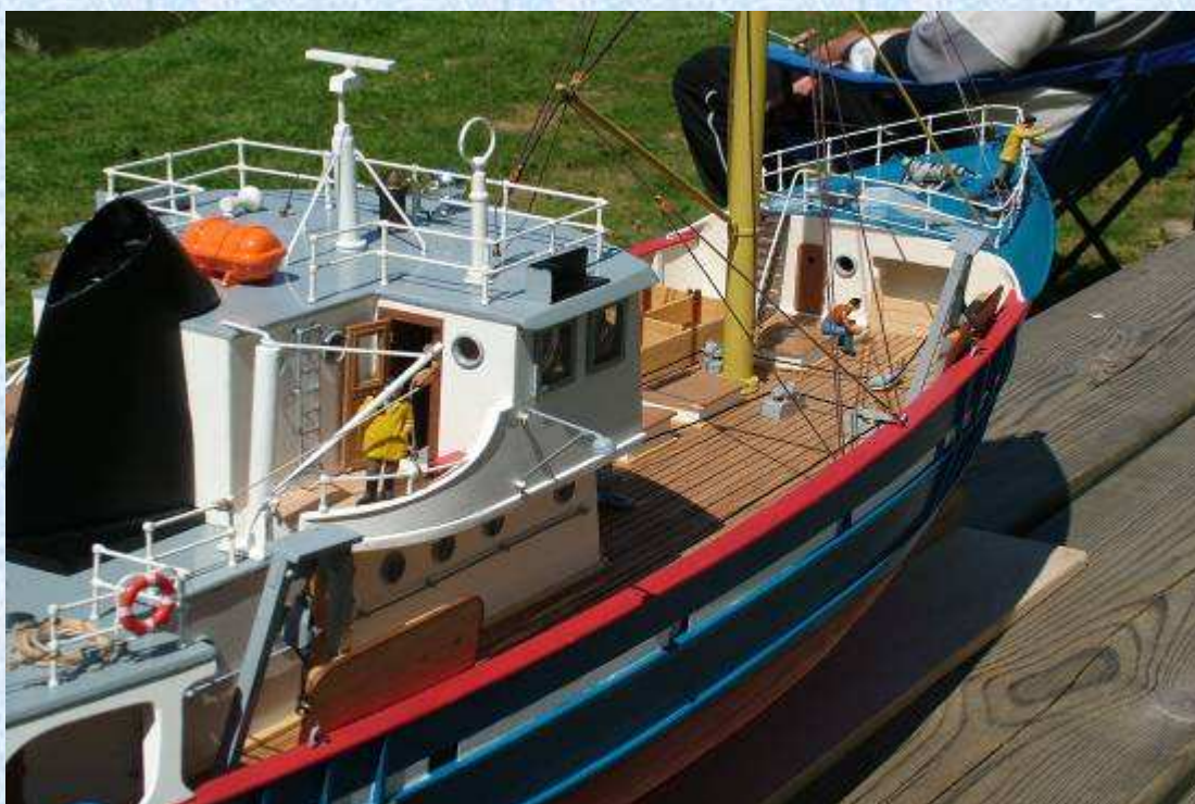
Gros plan sur tribord.