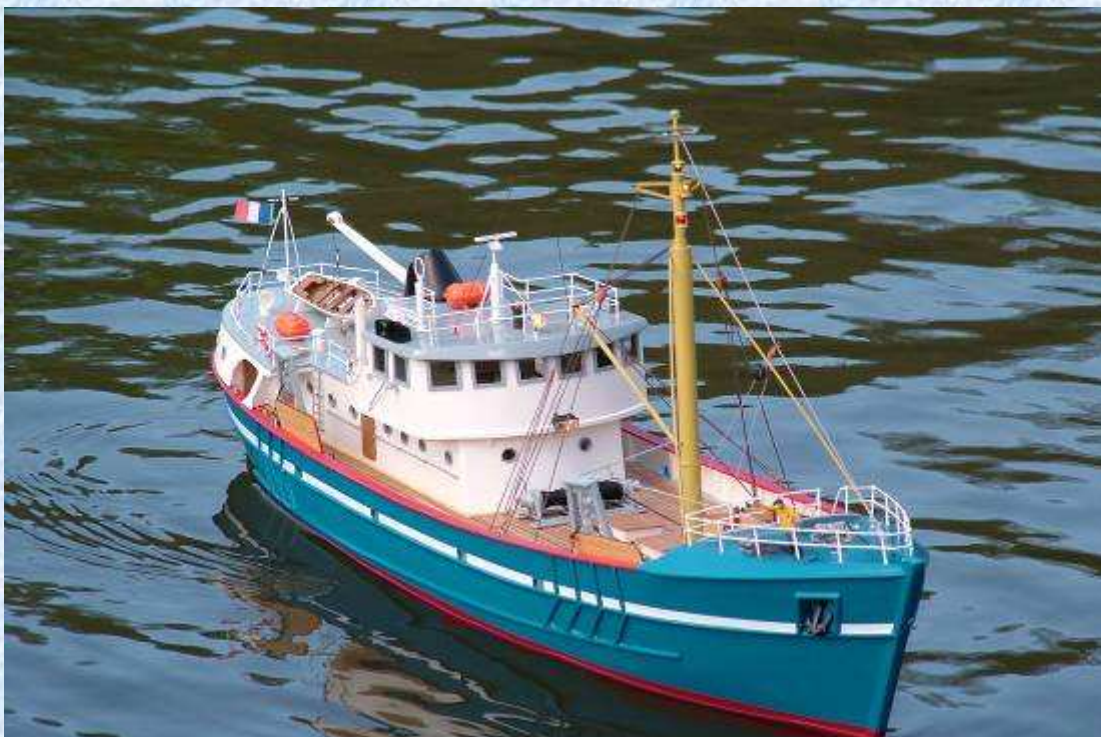
Première navigation après carénage.