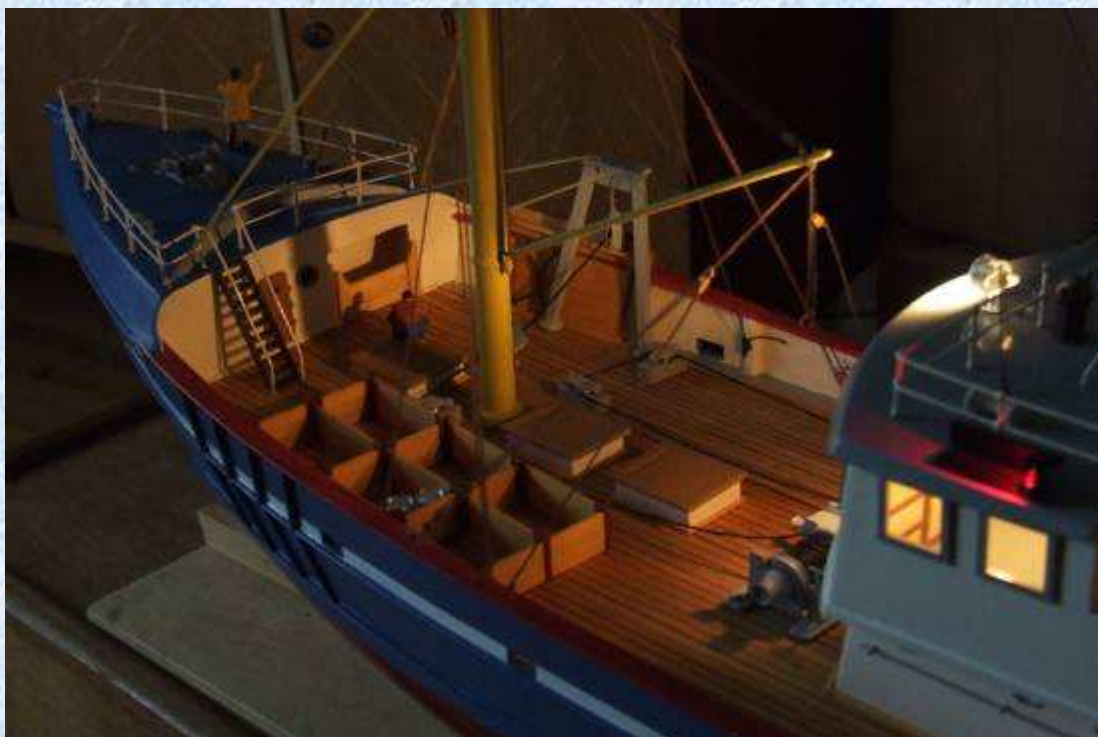
Vue sous un autre angle.